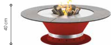
Modèle table basse RAL rouge présenté avec utilisation bois