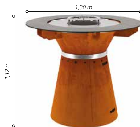
Modèle Corten présenté avec grille pour utilisation bois