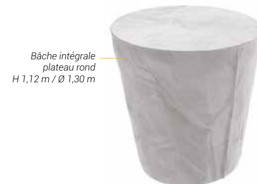
Bâche intégrale plateau rond H 1,12 m / Ø 1,30 m