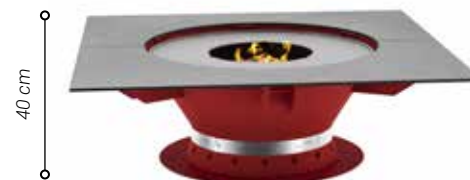
Exemple plateau carré 1,30 x 1,30 m