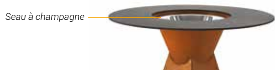
Seau à champagne