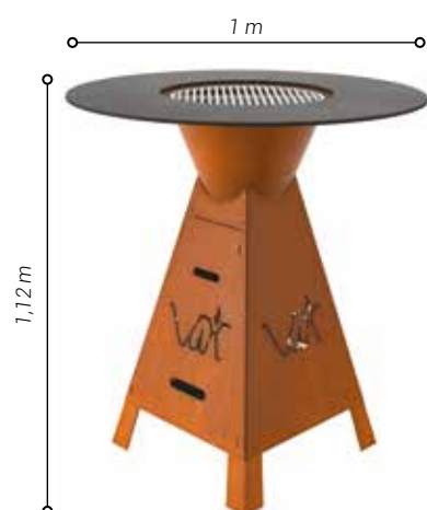
Modèle acier Corten - Table ronde