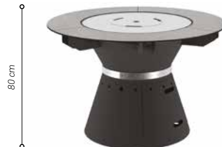
Modèle peinture noire présenté avec plancha gaz