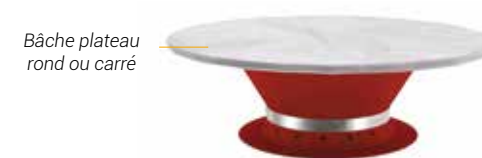
Bâche plateau rond ou carré